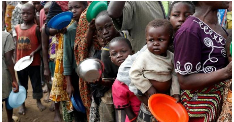
非洲粮食短缺问题导致的饥饿

在非洲，粮食短缺正在以惊人的速度增加。截至 2019 年，撒哈拉以南非洲地区有 2.34 亿人长期营养不良，比任何地区都多。在整个非洲，有 2.5 亿人正在经历饥饿，占人口的近 20%。东非各地